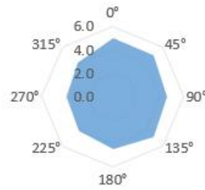
图 3 感知范围示意图