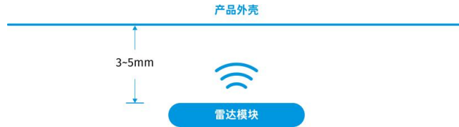
图 4 天线面与产品外壳的距离